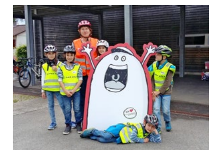
Spiel und Spass bei den beliebten Velofahrkursen von Pro Velo.