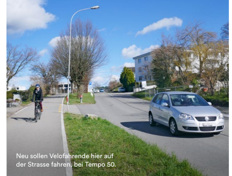
Neu sollen Velofahrende hier auf der Strasse fahren, bei Tempo 50.