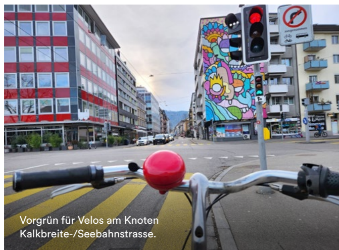
Vorgrün für Velos am Knoten Kalkbreite-/Seebahnstrasse.

Feststeht: Die DAV unternimmt derzeit einige Anstrengungen, um die Sicherheit und flüssige Fahrt für Velofahrende zu erhöhen. Wir hoffen darum, dass die Anzahl der Veloampeln weiterhin im selben Tempo wächst, also exponentiell. oo