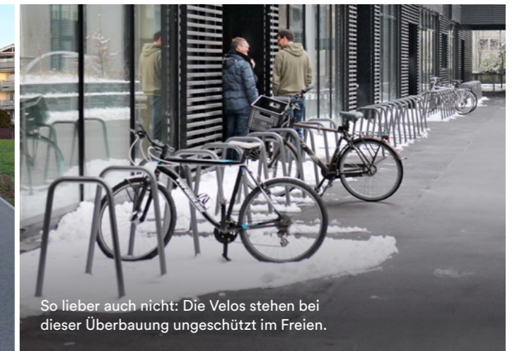
So lieber auch nicht: Die Velos stehen bei dieser Überbauung ungeschützt im Freien.