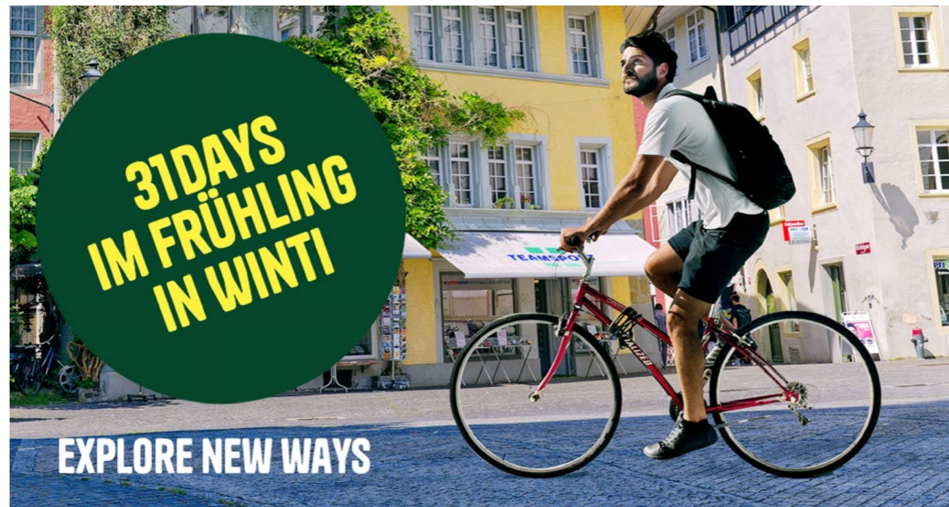
Einen Monat aufs Auto verzichten und trotzdem die komplette – oder sogar mehr – Freiheit erleben.