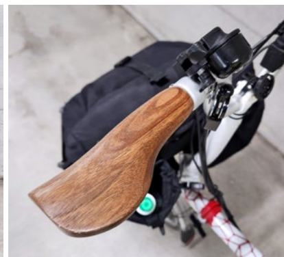
Das Extra: hölzerne Lenkergriffe mit eingebauter Federung.