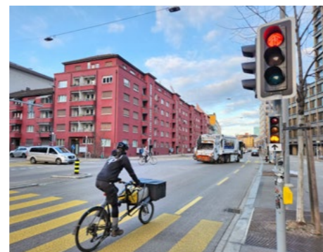
Nie mehr Rot für Velofahrende am Knoten Lagerstrasse/Kanonengasse.