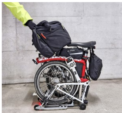
Das Packmass: in wenigen Sekunden auf 60 x 60 x 30 Zentimeter gefaltet.

Velobörsen bieten regelmässig zahlreiche Möglichkeiten.