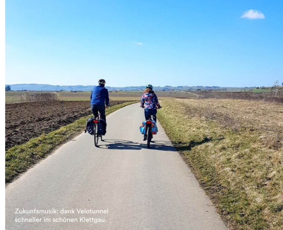
Zukunftsmusik: dank Velotunnel schneller im schönen Klettgau.