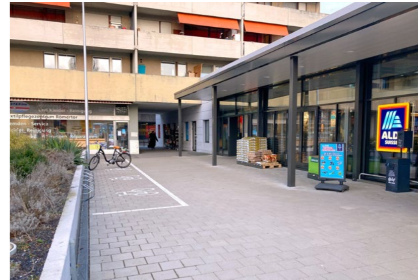
Veloparkierung nahe beim Eingang, aber leider kein Dach und billige Ständer.