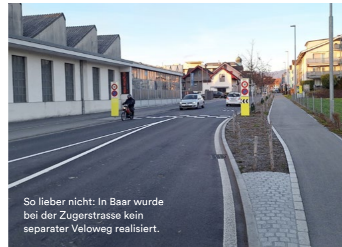
So lieber nicht: In Baar wurde bei der Zugerstrasse kein separater Veloweg realisiert.