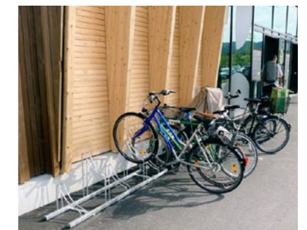
Der Coop Grüze hat das Abstellen von Velos am Seiteneingang legalisiert.

Der südliche Abschnitt der Wieshofstrasse ab Schlosstalstrasse in Wülflingen soll neu gestaltet werden. Dabei erfährt die SchweizMobil-Route 53 einige Verschlechterungen. Hauptsächlich beim Wäspimühle-Knoten, wo die Vortrittsverhältnisse zugunsten der Fahrbeziehung der Buslinie umgekehrt werden sollen, ist neu beim Geradeausfahren stadtauswärts ein «Linksabbiegen» notwendig. Obwohl es sich dabei um die anspruchsvollste Fahrbeziehung für Velos handelt, sind keinerlei «Hilfsmassnahmen» vorgesehen. Selbst auf die Einsprache von Pro Velo hin hat die Stadt keinerlei Verbesserungen in Aussicht gestellt. Die Webseite von SchweizMobil verweist schon heute auf die sehr verkehrsreiche Strecke in Wülflingen, die nun noch mit einer extrem heiklen Situation angereichert werden soll. Im Abschnitt Espenstrasse bis in der Euelwies sollen dann Velos auch auf dem einen Trottoir in beide Richtungen fahren dürfen, was wiederum von Pro Velo nicht goutiert wird. Da es keine geordneten Aus- und Einfahrten gibt und ein Abschnitt sehr steil ist, erachtet Pro Velo diese Lösung als viel zu gefährlich. Dieselbe Route 53 soll übrigens auch beim Rietereal in Töss mit einer Trottoirüberfahrt geschwächt werden. OO