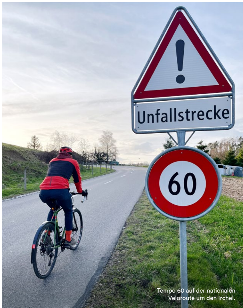
Tempo 60 auf der nationalen Veloroute um den Irchel.